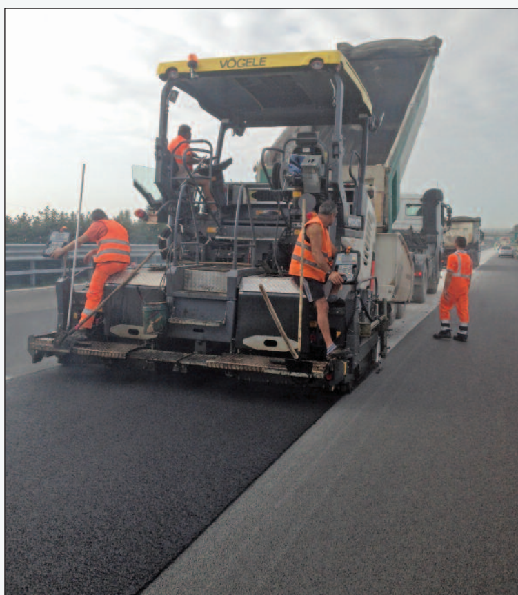
1. La stesa di conglomerato bituminoso sperimentale in sede autostradale (222+000 dell'ACP - Autostrade Centro Padane SpA)

Le autorizzazioni necessarie a trattare il materiale artificiale presso gli impianti di Lonato del Garda e Montichiari (BS), entrambi attigui ai siti produttivi del conglomerato bituminoso di proprietà Vezzola, hanno consentito di concentrare sia l'attività di approvvigionamento, trattamento e lavorazione della materia prima che il confezionamento del prodotto finito.